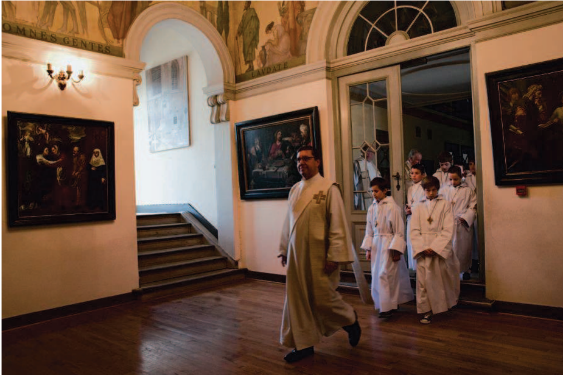
Plechtige communie College Paters Jozefieten, Melle 2011