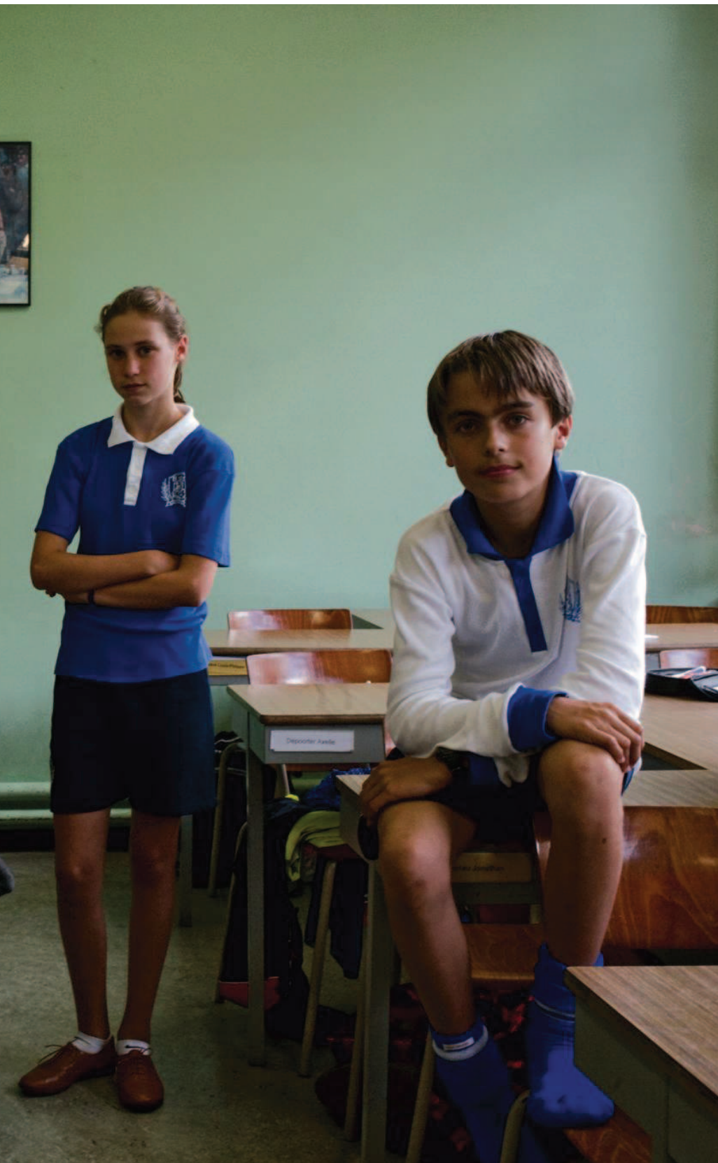
Klasportret Abdijschool van Zevenkerken, Sint-Andries 2012