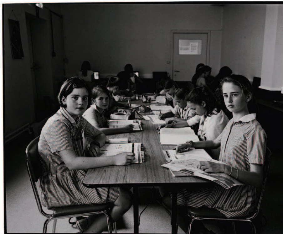
Studiezaal internaat Nieuwen Bosch, Gent 2012