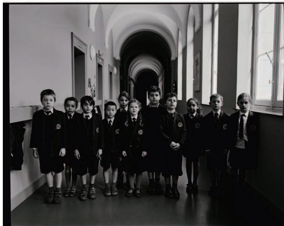
Klasportret lagere school Onze-Lieve- Vrouwecollege, Antwerpen 2011