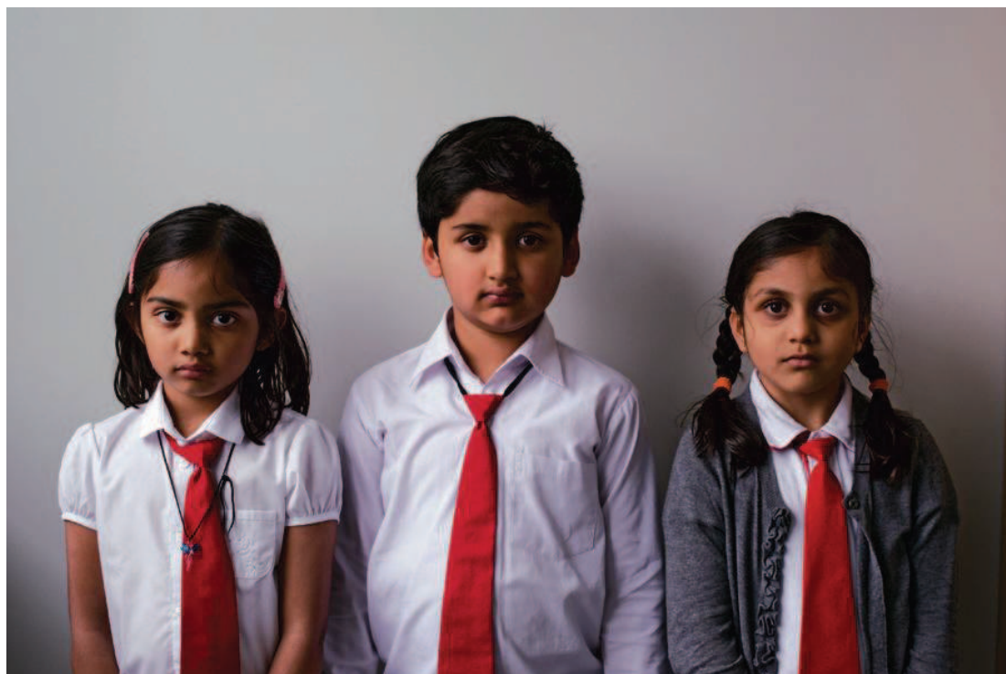
Groepsportret DY Patil International School, Aartselaar 2013