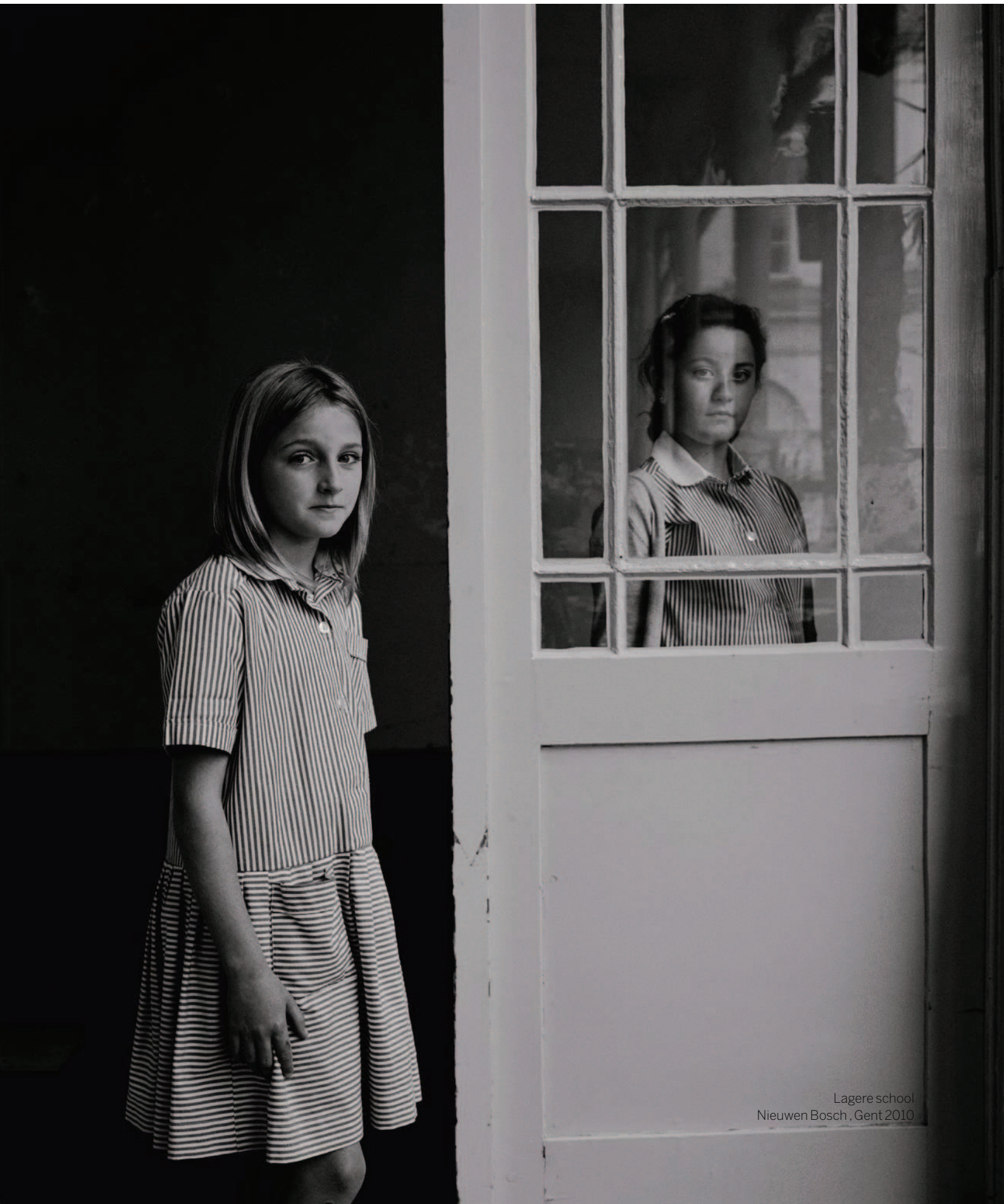
Lagere school Nieuwen Bosch, Gent 2010