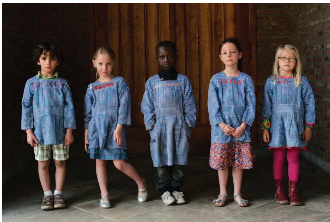
Kleuterklas Onze-Lieve-Vrouw- instituut Pulhof, Berchem 2013