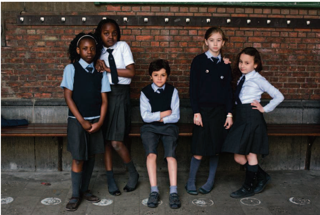
Sint-Jan Berchmanscollege, Antwerpen 2011